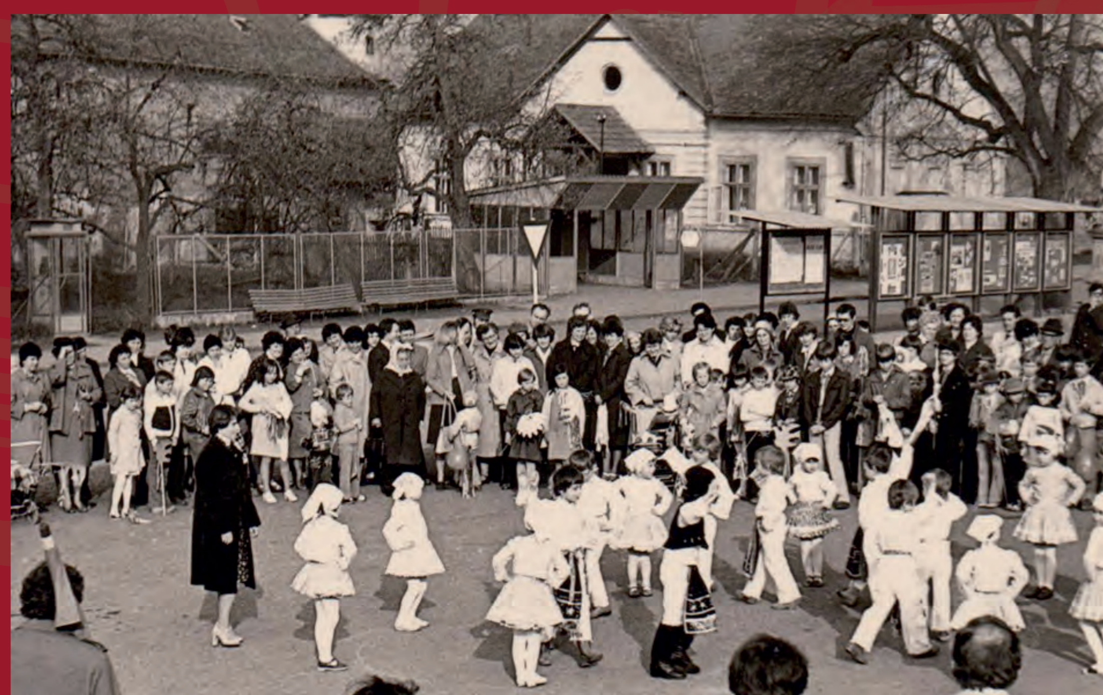
1. máj, r. 1980