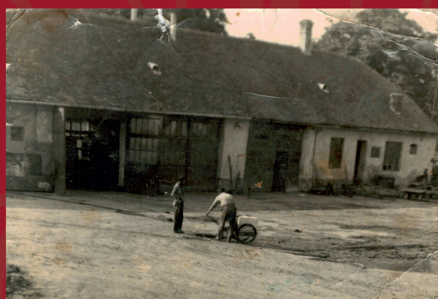
život na Velehradě

V období mezi dvěma světovými válkami si na Velehradě zachovávala své dominantní politické postavení sdružení občansko – křesťanských stran. Zastupitelstvo mělo v této době celkem 15 členů a pracovaly při něm i jednotlivé výbory (např. finanční či stavební). Po únorovém převratu byl obecní úřad přejmenován na místní národní výbor. Měl 24 členů a pracovalo při něm celkem sedm referátů a řada dalších komisí. Plenární zasedání se konala jednou za dva měsíce. V roce 1973 byla dokončena výstavba nové budovy MNV (dnešní obecní úřad). První demokratické volby proběhly na Velehradě 24. listopadu 1990 a vzešlo z nich 11 nových zastupitelů, kteří ze svého středu vybrali starostu.