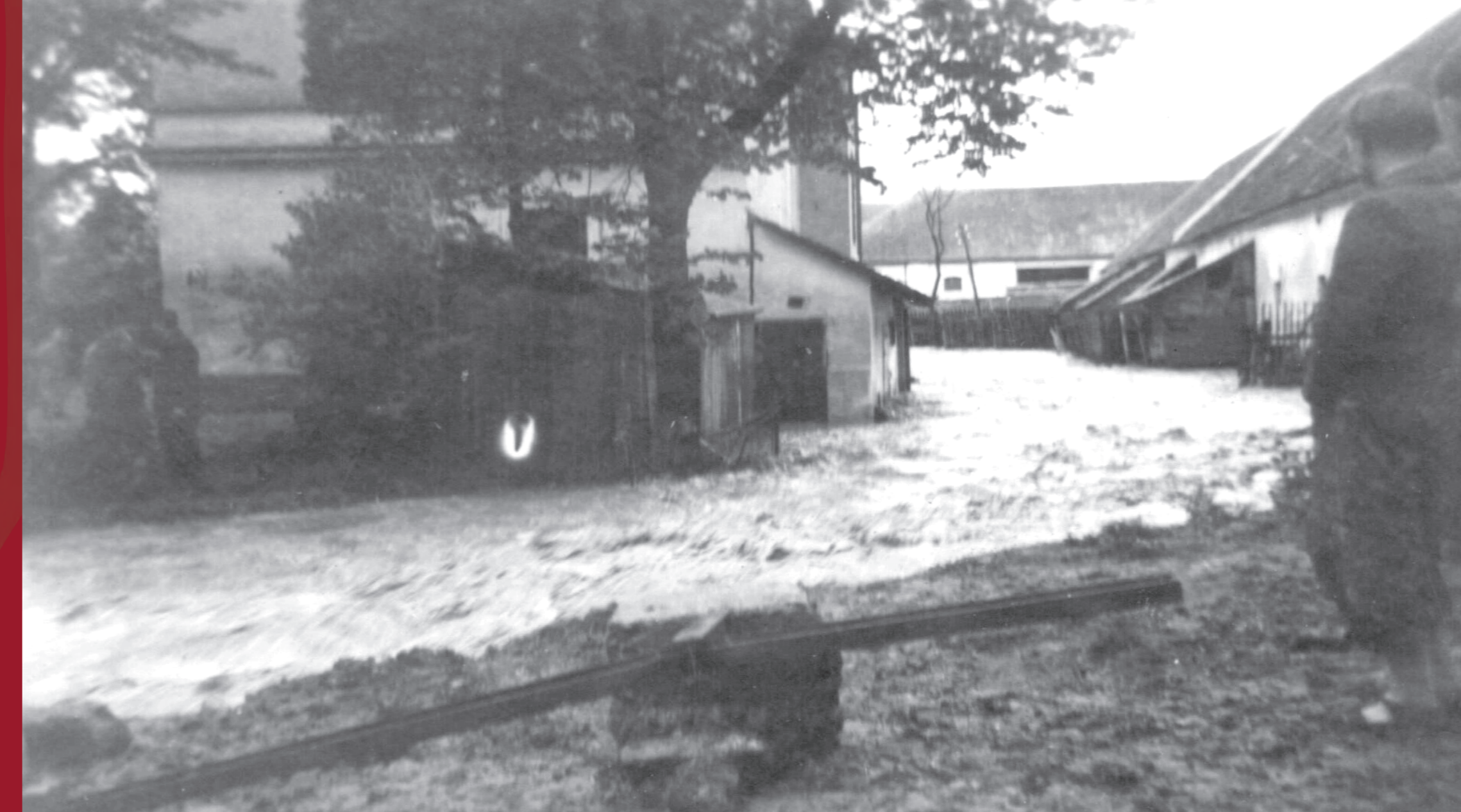
povodeň, r. 1942