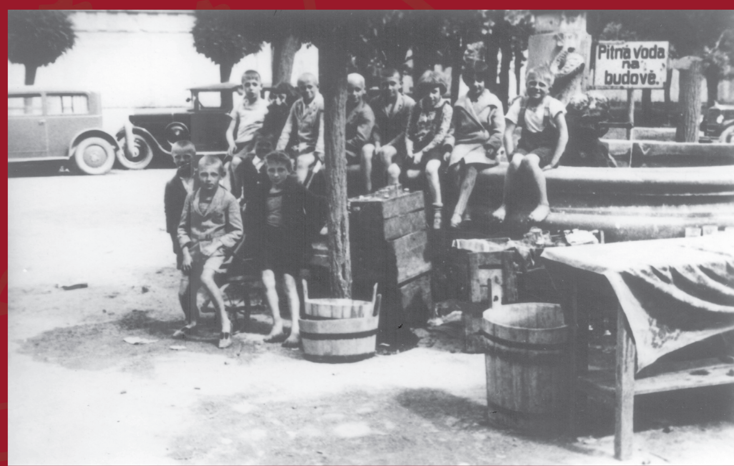
život, r. 1972

Po roce 1848 došlo ve vývoji samosprávy k významným změnám. Byl totiž volen obecní výbor (společný pro Velehrad i Modrou) a obecní představenstvo, tvořené představeným (starostou) a alespoň dvěma radními. Tíha odpovědnosti ležela na představeném, radní mu pouze pomáhali. Představenstvo bylo voleno na tři roky, poprvé se tak stalo v roce 1850. Toto uspořádání zůstávalo stejné prakticky až do roku 1919.